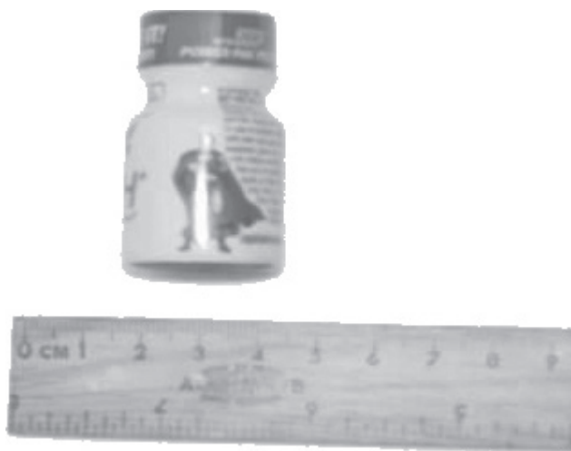
Figura 1. Fotografía de un frasco de poppers.

Las consecuencias del consumo de poppers incluyen aumento de la presión intracraneal, taquicardia, mareos, debilidad, palidez, dolores de cabeza, náusea, vómito, irritaciones alrededor de los labios, mejillas y nariz y dermatitis. 10,11,16,17 Entre los efectos más graves se encuentran el desarrollo de neumonía lipoidea. 18